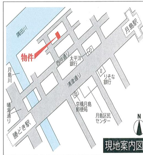
※図面と現況が異なる場合は現況を優先とさせていただきます。